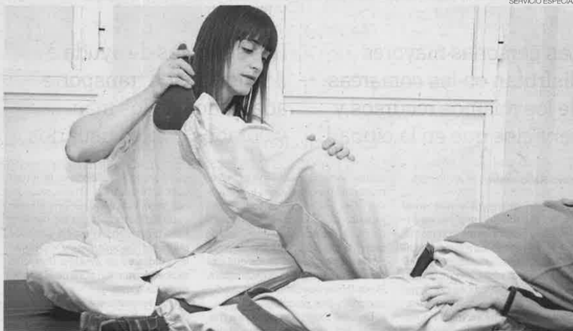
► Los usuarios y usuarias de Huesca disponen de servicio de fisioterapia y rehabilitación.

Asimismo, Fundación DFA en Huesca dispone de un servicio de fisioterapia y rehabilitación, desde el cual se proporciona al usuario una atención integral e individualizada a través de la valoración, el tratamiento y el seguimiento de la evolución. Está dirigido a personas con y sin discapacidad, de todas las edades,