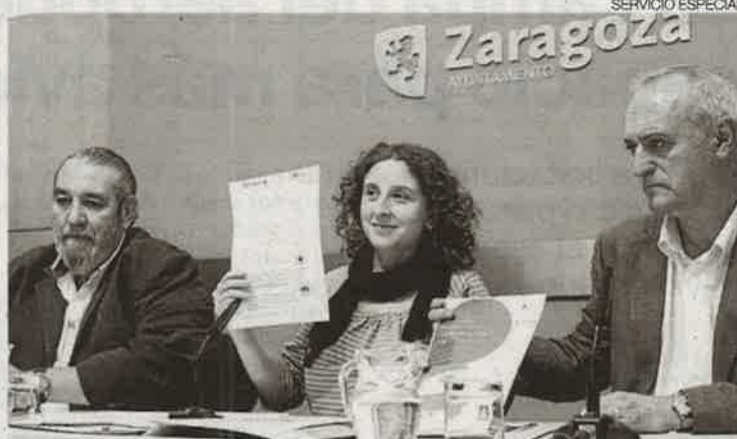
►► Firma del convenio con el Ayuntamiento de Zaragoza.

Gracias a este acuerdo, el Ayuntamiento de Zaragoza va a estudiar la accesibilidad cognitiva de la escuela y los conservatorios