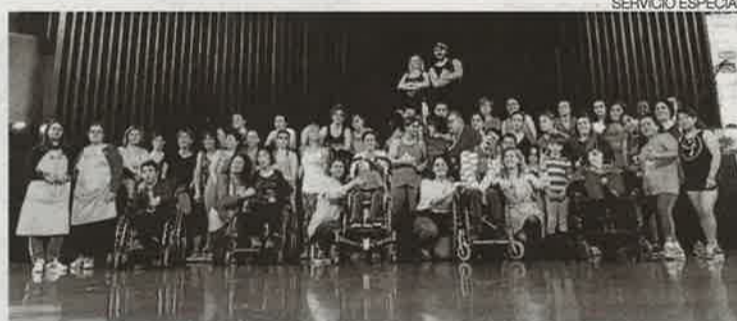
►► Participantes en el festival organizado el año pasado por Araprode.

El festival, que un año más cuenta con el apoyo de Fundación CAI, se desarrollará de 10.30 a 21 horas con un intenso y divertido programa en el que no